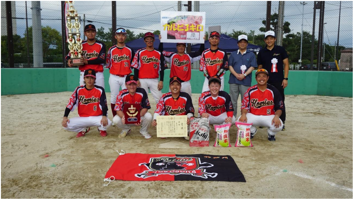
優勝 横須賀 HOMIES