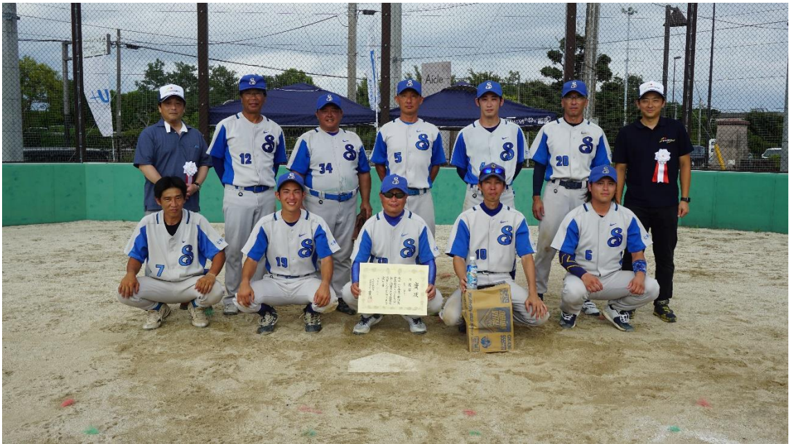
準優勝 長沢七軒町