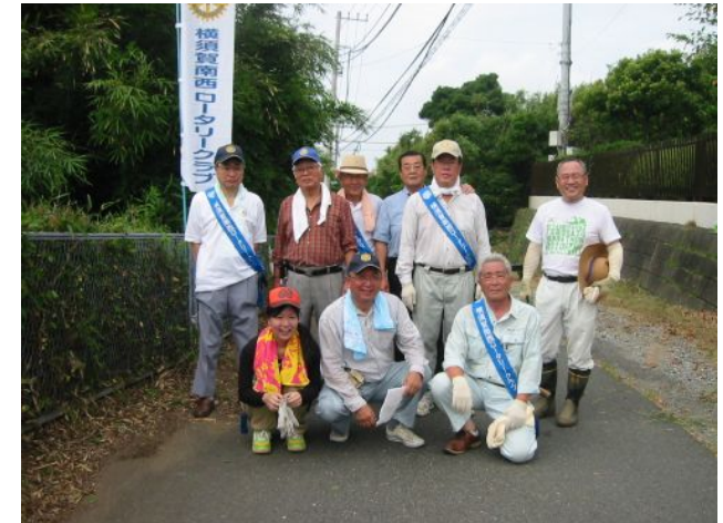
横須賀老人ホーム草刈り 2011/07/18