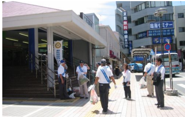
2012/07/16 北久里浜商店街清掃